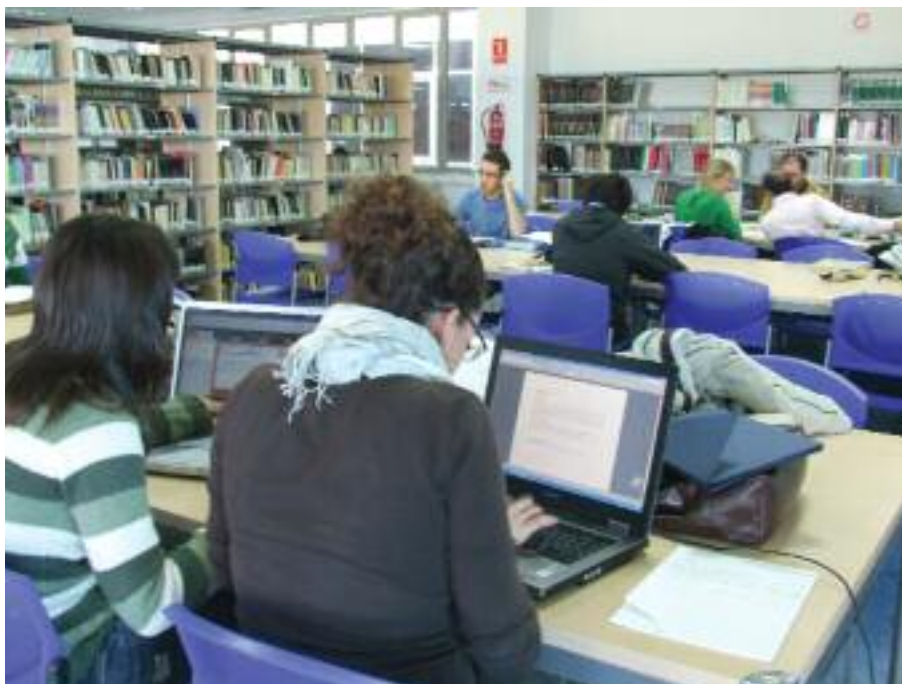
Biblioteca de la Facultad de Comunicación de la Universidad de Sevilla.

La transformación de la Biblioteca, comprometida con los ideales y objetivos de la Universidad, está basada en la necesidad de adaptar sus productos y servicios, por una parte, a las nuevas formas de estudio y aprendizaje y a las nuevas necesidades de profesores y estudiantes, derivadas ambas del Espacio Europeo de Educación Superior y, por otra, a las tecnologías de la información y la comunicación y a los hábitos de uso de la información, especialmente de los estudiantes.